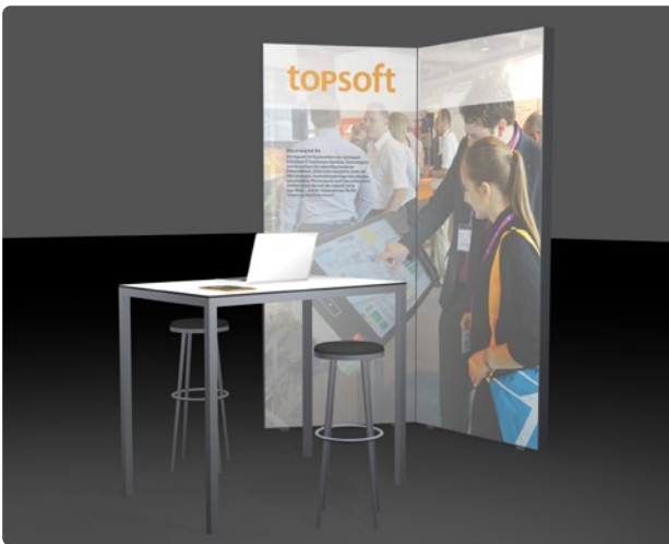
Modulstand mit beleuchteten Slimframes

Der Anspruch an qualitativ hochstehende Produktdaten steigt kontinuierlich. Die für eine effiziente Pflege und Verwaltung benötigten PIM / MAM Lösungen haben keine grosse Verbreitung gefunden. An der topsoft 2020, der grössten und renommiertesten Schweizer IT-Fachmesse, haben ausgewählte PIM / MAM Anbieter die Möglichkeit, sich und ihre Lösungen einem interessierten Fachpublikum zu präsentieren.